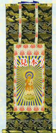
御本尊 (阿弥陀如来)