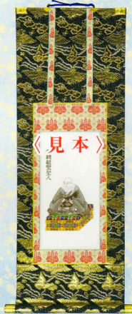
親鸞聖人 (宗祖・祖師)